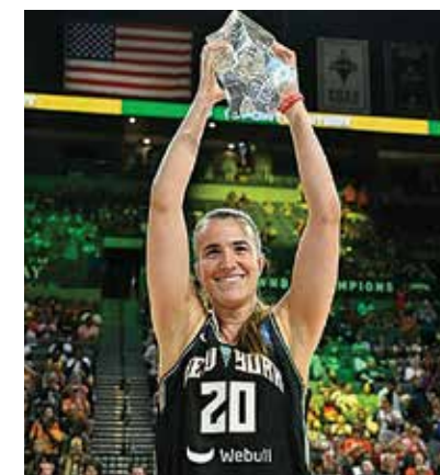
SABRINA IONESCU - Baschetbalistă, Oregon, SUA