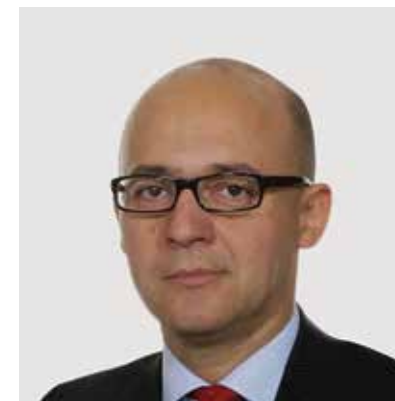
MIHAI RADU - Expert consultant endocrine specializat în cancer, tiroidă, Oxford, UK