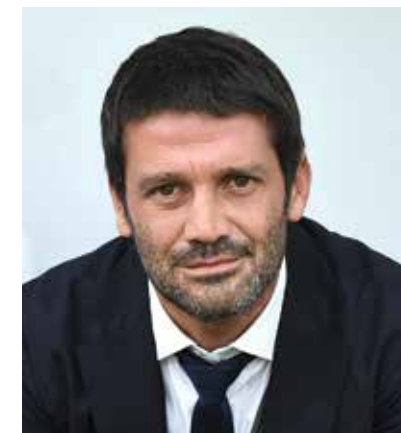
CRISTIAN CHIVU - Antrenor, Milano, Italia