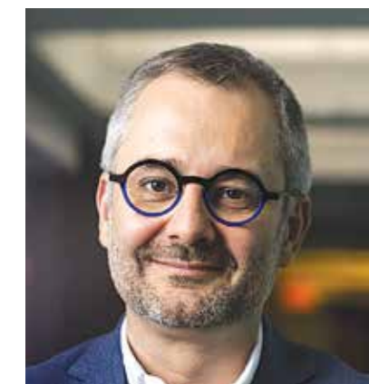
ALBERT-LÁSZLÓ BARABAȘI - Cercetător, Harvard, SUA